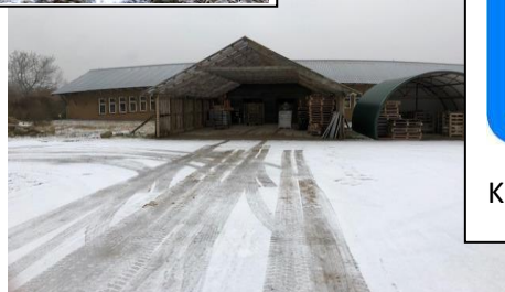
Stævne center, Lundhede Planteskole