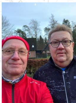
Kopp og Klode (Banelægger)

Billede med Naturcenter Damhus i baggrunden